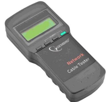
NCT-3 Tester Digital UTP Medida de Long. circuito abierto.