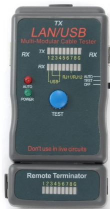
NCT-2 Tester UTP-USB