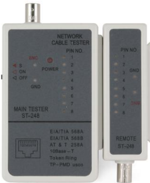
NCT-1 Mini tester UTP + BNC