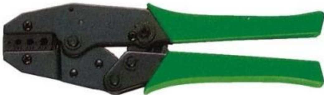
Tenaza para crimpar RG58/59/174