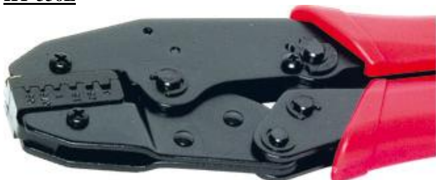
Maquina de crimpado pra terminales cerrados de PUNTERAS.