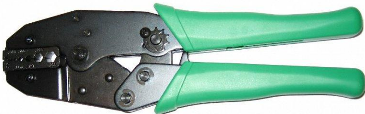
Tenaza para crimpar RG58/59/62/174

José Del Hierro 44 28027 Madrid Tel: 913671690 Fax: 913775401 e-Mail: palcoelectronic@hotmail.com